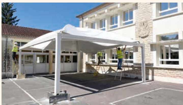
Installation d'un dôme dans la cour de l'élémentaire pour permettre aux enfants de réaliser des activités à l'ombre ou protégés en cas de pluie.

Chaque année, la Ville investit pour améliorer le cadre de vie des enfants et leur fournir les meilleures conditions dans leur scolarité. Des travaux d'entretien et de maintenance des groupes scolaires sont conduits régulièrement. La période estivale est la plus propice pour réaliser ces chantiers. C'est ainsi qu'à cette rentrée, les élèves découvrent des changements dans leur établissement :