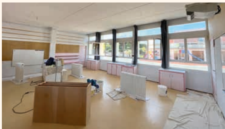
Réfection de deux salles de classe : travaux de peinture, relampage LED et remplacement du sol dans une des salles.

Avec le mobilier scolaire fabriqué par le Centre Technique Municipal, l'ensemble de ces travaux représentent un investissement de 60 000 € HT.