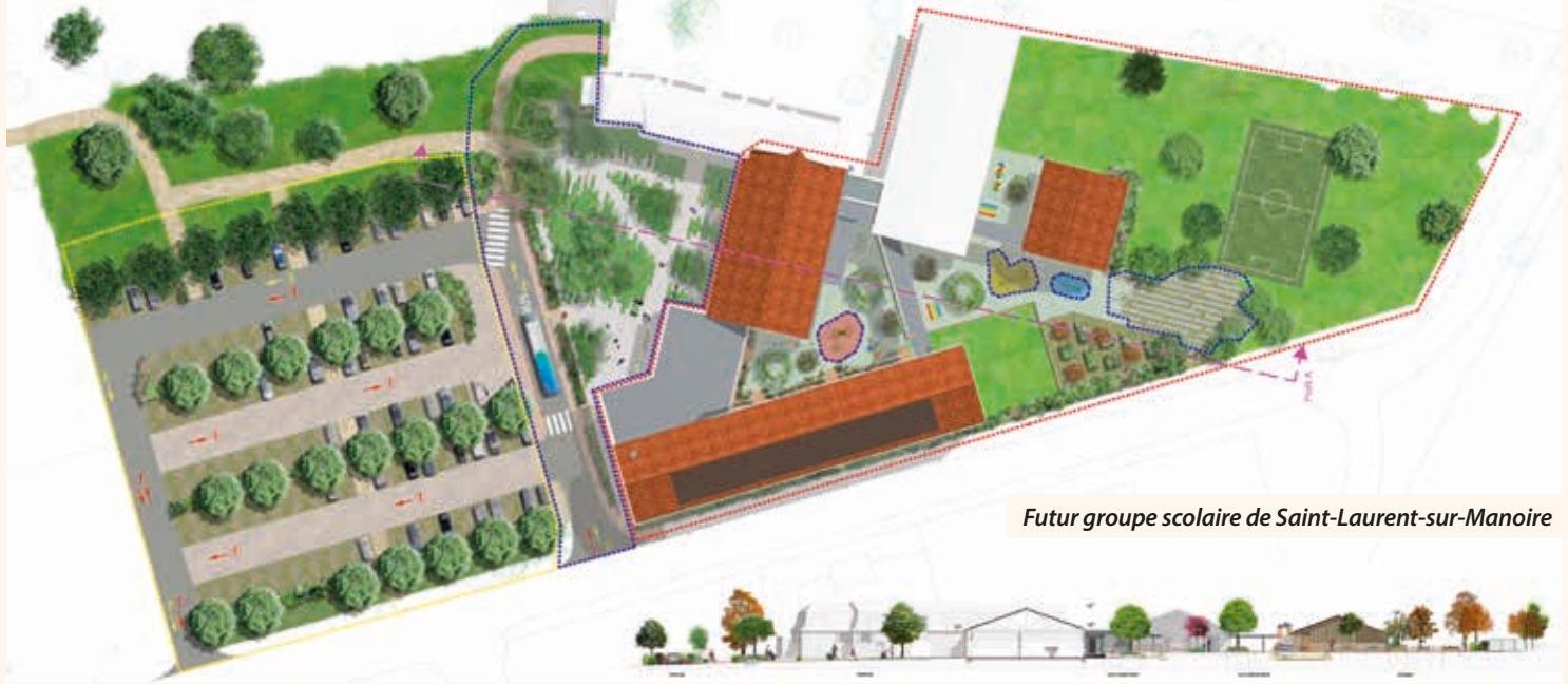
Futur groupe scolaire de Saint-Laurent-sur-Manoire