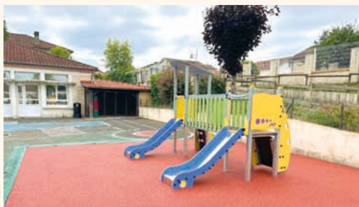
Installation d'une structure de jeux dans la cour de la maternelle.

Avec le mobilier scolaire fabriqué par le Centre Technique Municipal, l'ensemble de ces travaux représentent un investissement de 60 000 € HT.