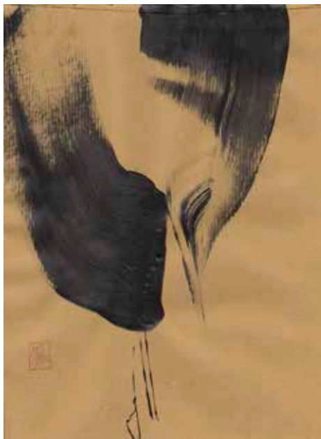
Kraft_6 - peinture acrylique sur papier kraft - 20 x 28 cm