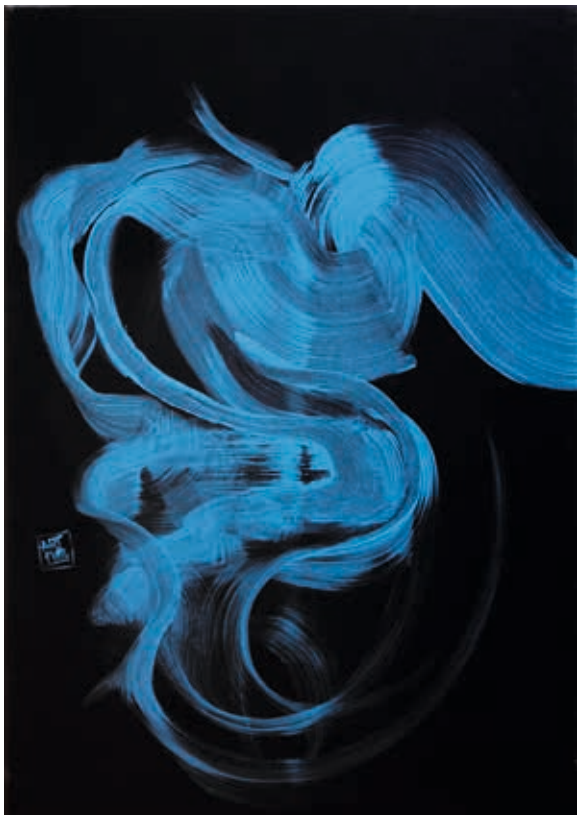
Bleu_14 - peinture acrylique sur toile coton - 70 x 100 cm

› Vernissage samedi 10 octobre à partir de 18h