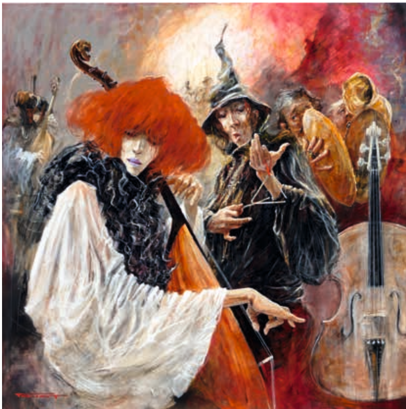
Le Triangle - Technique mixte sur toile 100 x 100 cm

› Vernissage samedi 12 juin à partir de 18h