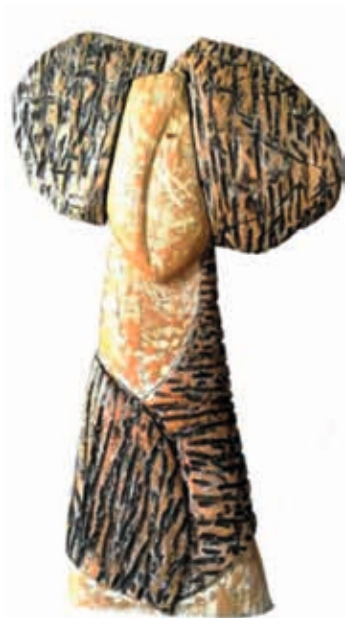
Buste en noir et blanc – Bois de chêne – H 84 cm