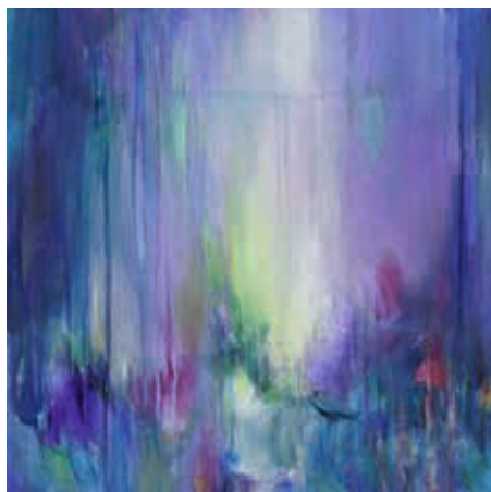
Eden – peinture acrylique – 60 x 60cm