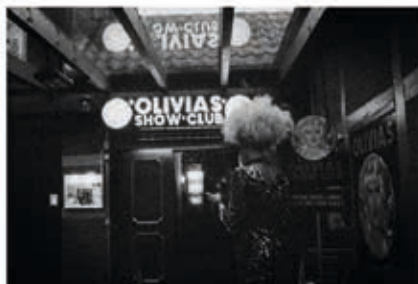
Œuvre Olivia 's - Argentique 24-36 noir et blanc