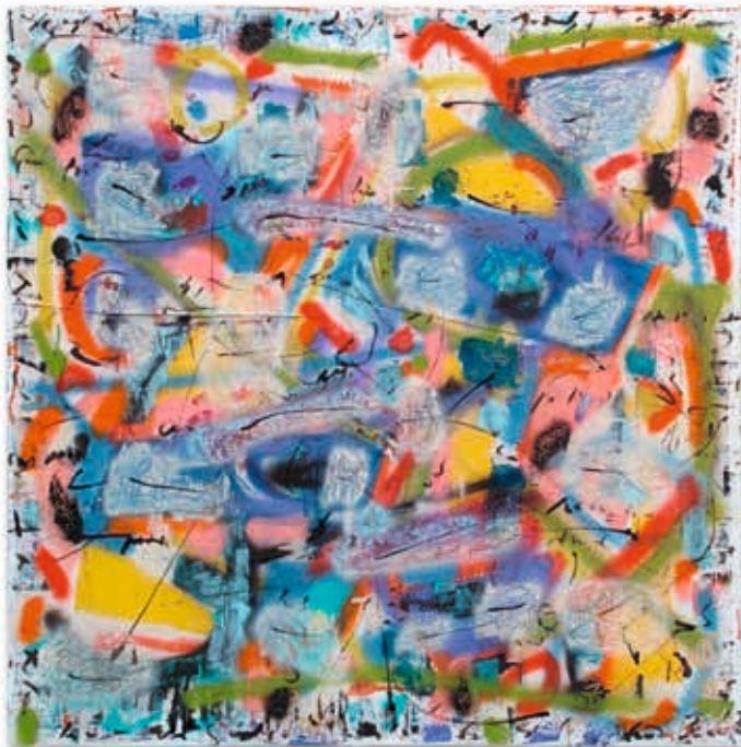
Œil du tigre- technique mixte sur toile - 100 x 100 cm

› Vernissage samedi 15 mai à partir de 18 h