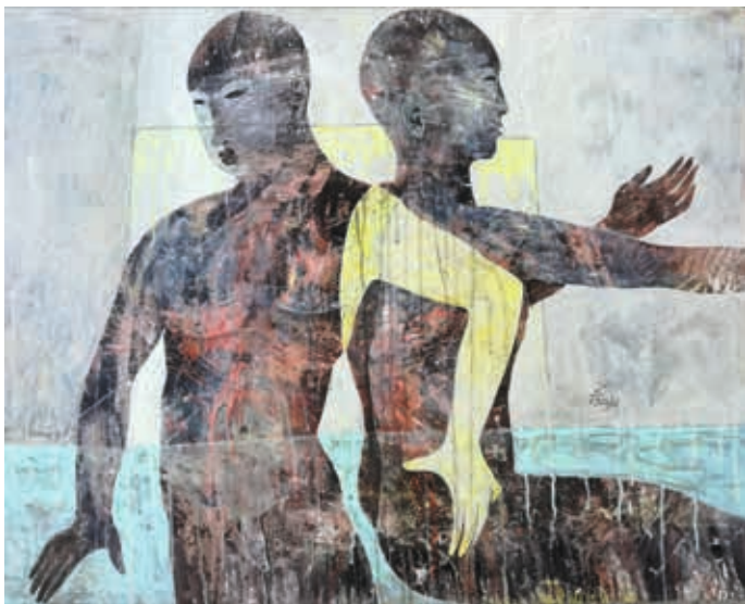
Danseurs -Technique mixte sur toile - 73 x 92 cm

› Vernissage samedi 10 avril à partir de 18 h