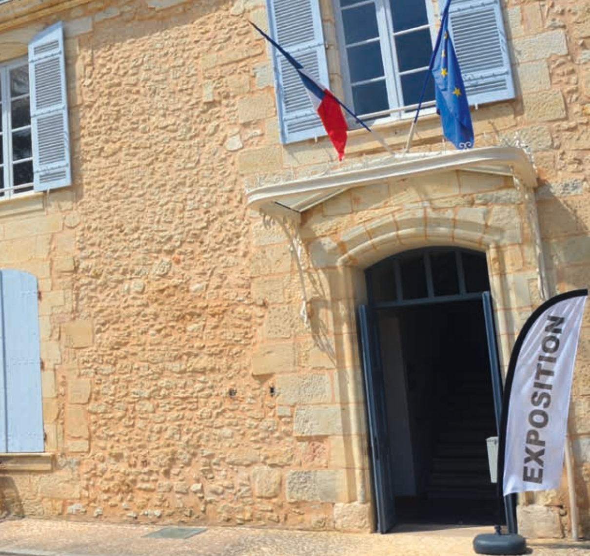
Le château de Saint Laurent sur Manoire : l'entrée de l'exposition