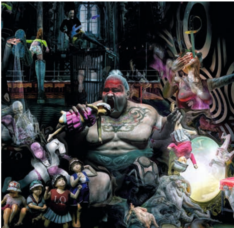
Série « Contes et légendes » - Le petit Poucet, opéra rock - Technique mixte : Photo/Digital Painting/3D

› Vernissage samedi 12 décembre à partir de 18 h