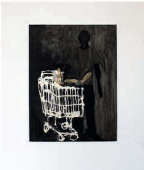
Vendeur de maïs chaud - 80 x 60cm

› Vernissage samedi 9 janvier à partir de 18h