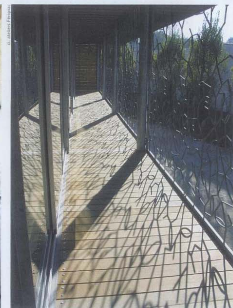
Les courbes végétales du moucharabieh conçu par le plasticien Michel Brand se diffusent dans la galerie des ateliers Férignac.