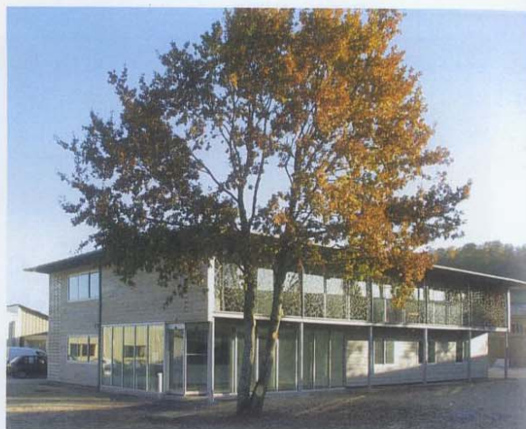
Les ateliers Férignac, à Hautefort. Pour se démarquer du traditionnel hangar industriel, l'architecte utilise du bois et des matériaux employés dans la restauration de monuments historiques.