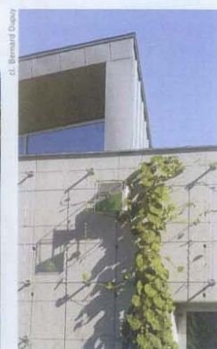
Émanant du jardin, les plantes gagnent les façades de béton brut.

immédiatement lisible, marqué par l'élan mesuré d'un grand shed assurant l'éclairage zénithal. Simple, accessible, rassurant, le bâtiment reçoit sur ses façades des filins d'acier accueillant la végétation grimpanche. La finesse des emboîtements volumétriques, la juste mise en œuvre des lignes, l'attention portée aux ombres transforment l'édifice en un parcours visuel et sensible