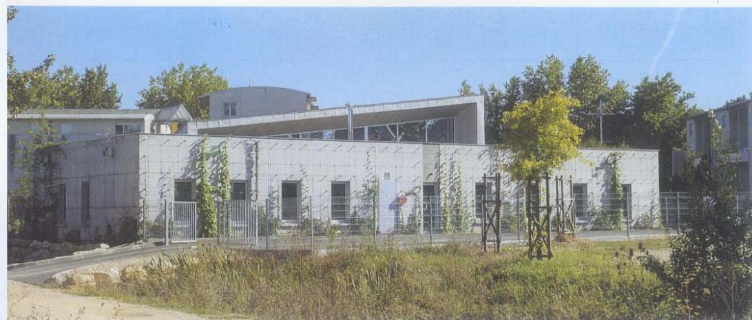
Centre médico-social de Boulazac.